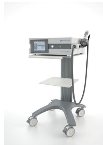
Ondes de choc focalisées Chattanooga

En plus de leur effet antidouleur, les réactions biologiques produites par les ondes de choc permettent une accélération du processus cicatriciel.