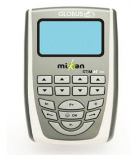
StimVet, gamme Globus

Les indications les plus fréquentes sont l'amyotrophie, le renforcement musculaire, le déconditionnement et les atteintes neurologiques. A noter que l'électrostimulation, comme les autres thérapies, s'inscrit dans un protocole de soins variable selon l'état et l'historique de l'animal, alliant des exercices de kinésithérapie, l'hydrothérapie et les massages.